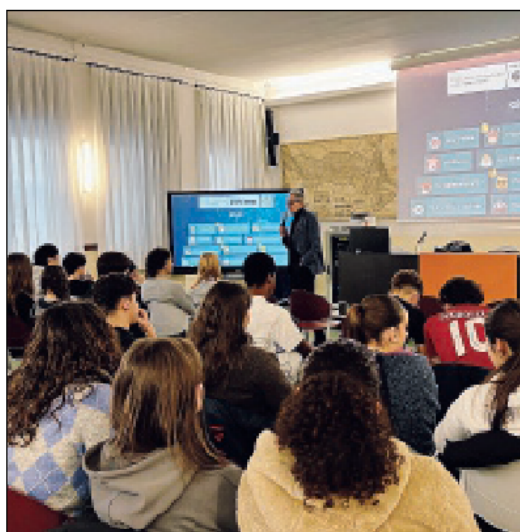
Il percorso di educazione finanziaria a cui hanno partecipato gli studenti dell'istituto De Amicis

Le classi terze hanno partecipato all'incontro dedicato al tema "Moneta elettronica, informatizzazione e digitalizzazione dei sistemi finanziari", approfondendo il cambiamento introdotto